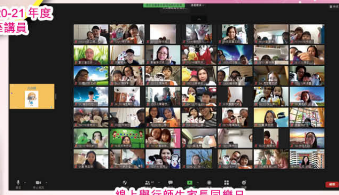
線上舉行師生家長同樂日