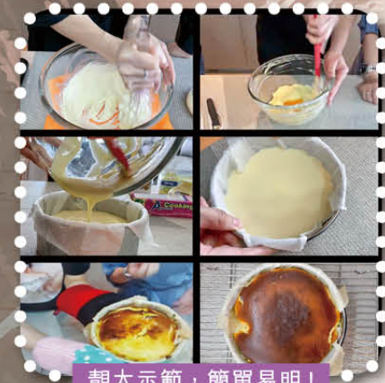
靚太示範，簡單易明！