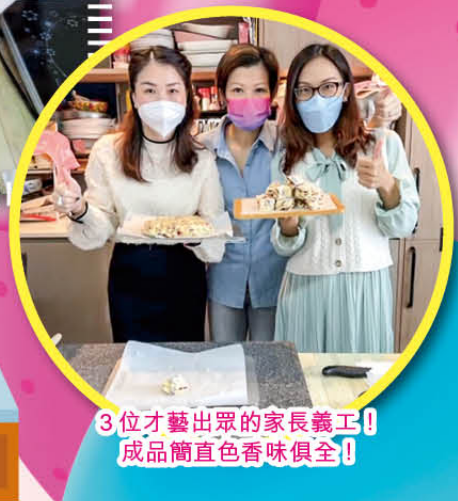
3位才藝出眾的家長義工! 成品簡直色香味俱全!