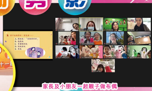
家長及小朋友一起親子做布偶