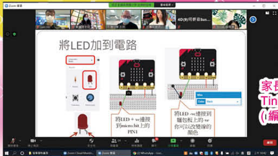
家長和同學投入地學習 TinkerCAD x Micro:bit (編程)!