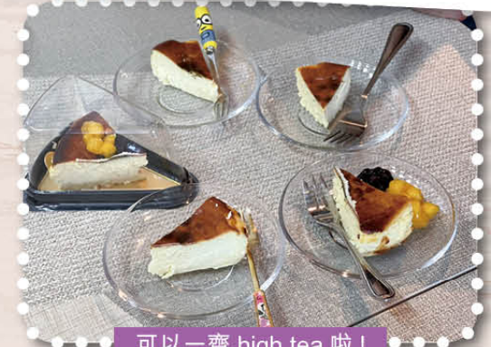
可以一齊 high tea 啦！