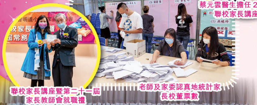
聯校家長講座暨第二十一屆家長教師會就職禮