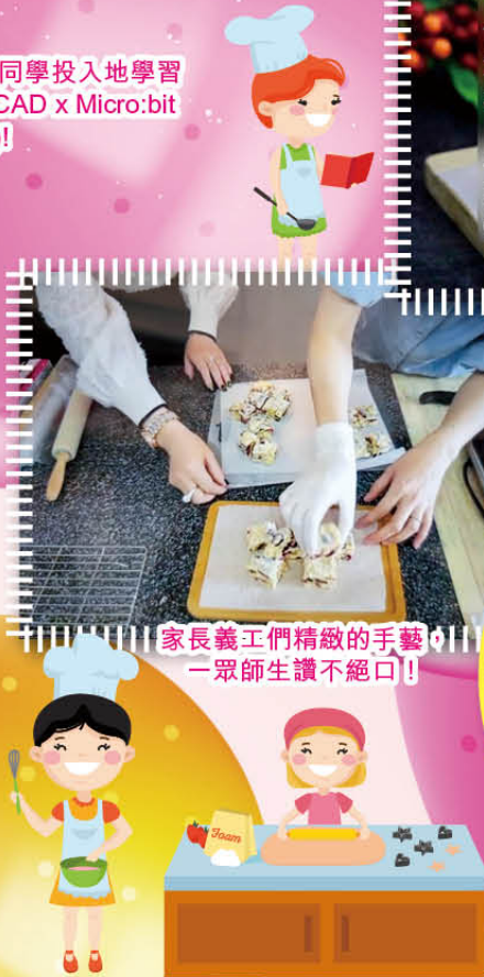
家長義工們精緻的手藝， 一眾師生讚不絕口!