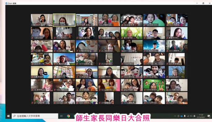
師生家長同樂日大合照