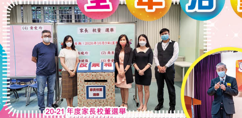
20-21 年度家長校董選舉