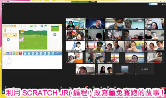
利用 SCRATCH JR(編程) 改寫龜兔賽跑的故事!