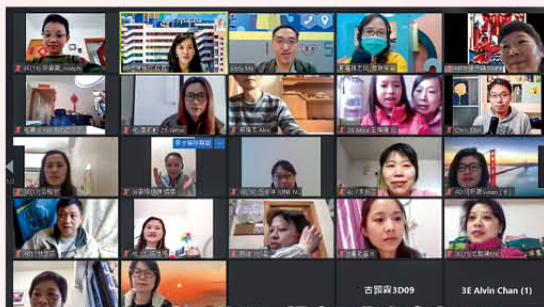
小三至小四家長的專題講座，你有參與嗎？