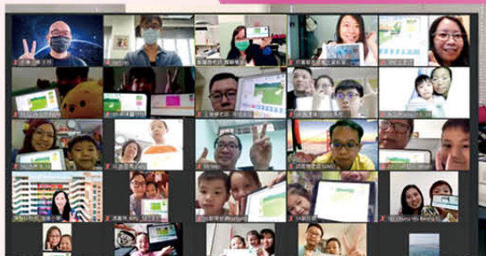
本校首次利用視像方式(zoom)進行親子STEM工作坊。